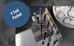
9 Tool Pocket