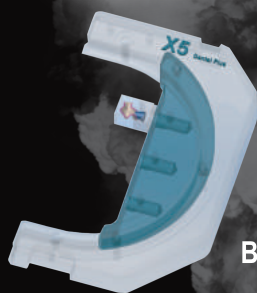
Block Type jig